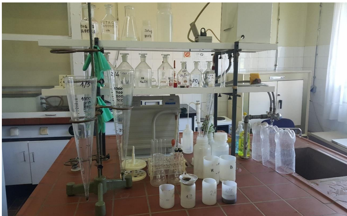
Лабораторија за мерење на пречистените отпадните води во Враништа - Струга

3.5. Ревизијата изврши анализа на доставената документација за приклученост на населените места во општините Охрид, Струга и Дебрца на колекторскиот систем, за користењето на сепаратни пречистителни станици или користењето индивидуални септички јами и ја утврди следната состојба: