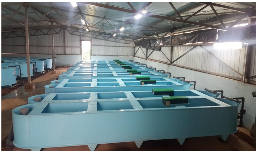
Мрестилиште за охридската пастрмка во ЈНУ Хидробиолошки завод – Охрид