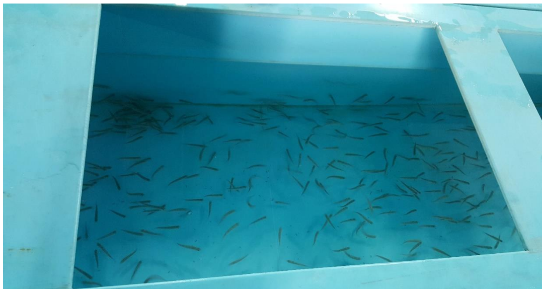
Одгледување на подмладок на охридската пастрмка во ЈНУ Хидробиолошки завод- Охрид