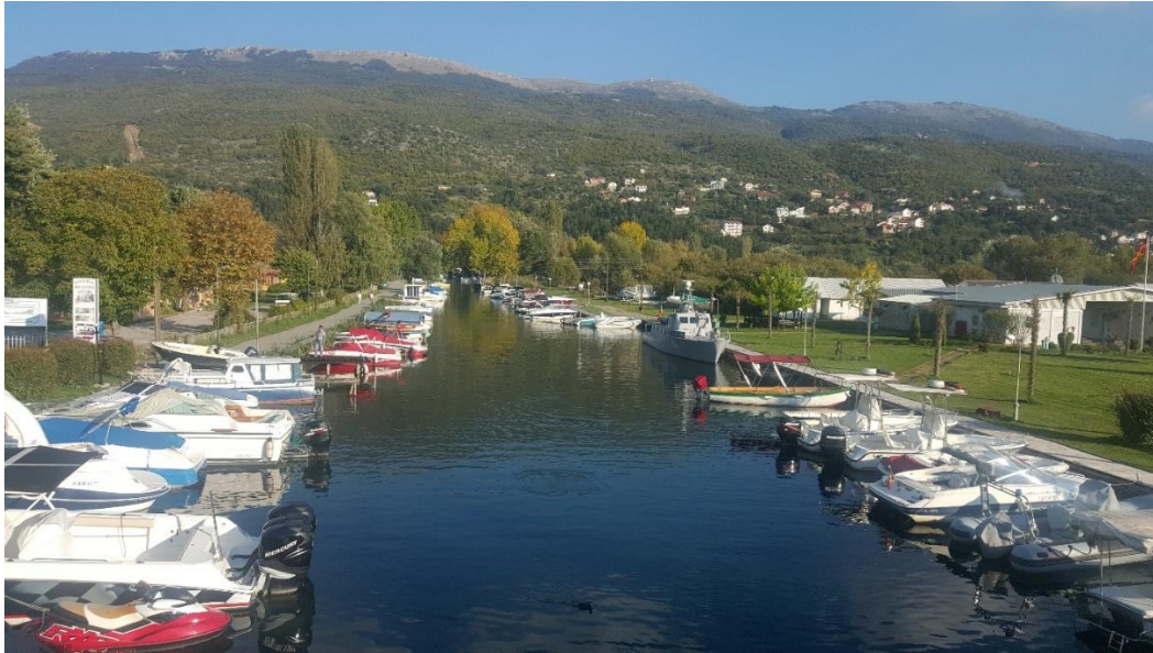
Канал Билјанини извори

Охридското езеро, со изградбата на Марината, како и со реализацијата на останатите проекти ќе се придонесе за поголема ефикасност во заштита на Охридското езеро.