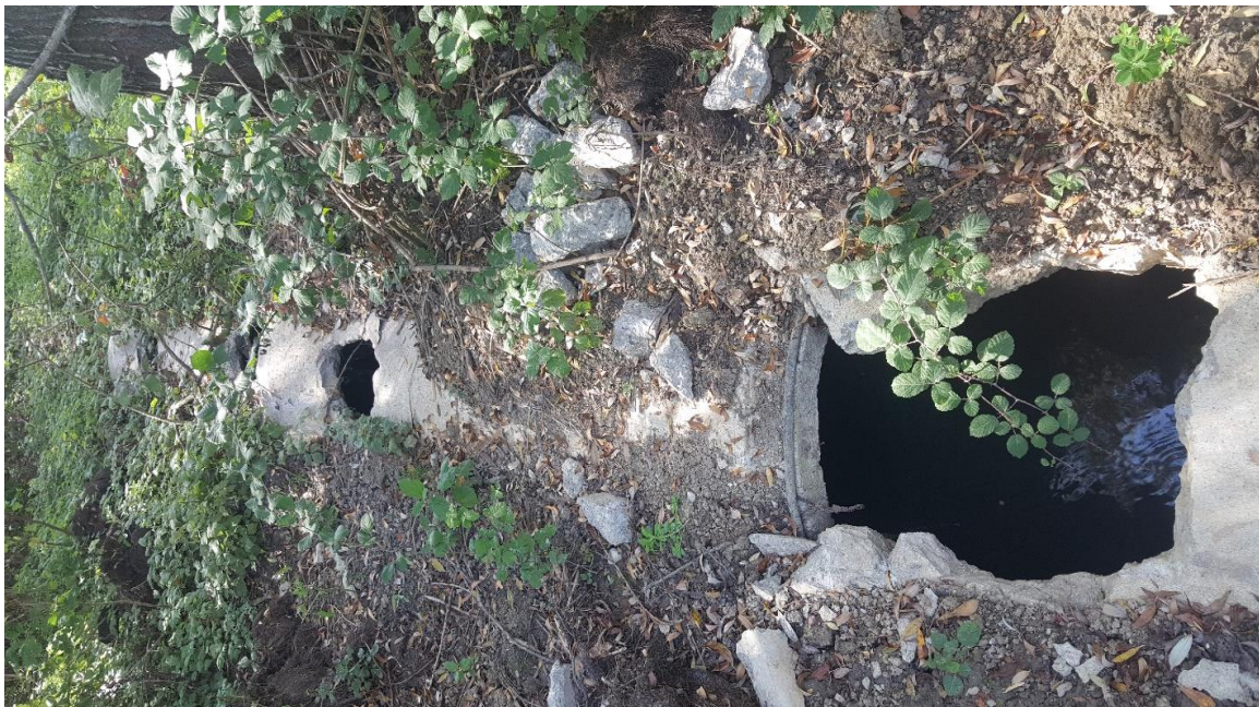
Оштетувања на цевководот на колекторскиот систем за отпадни води