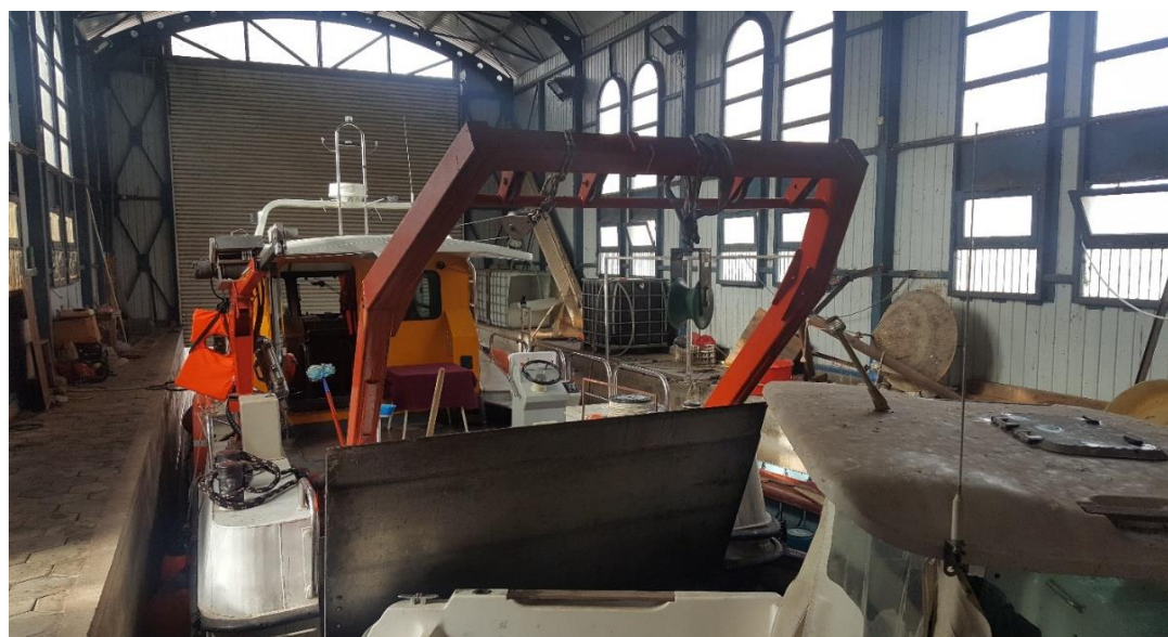
Брод кој што ЈНУ Хидробиолошки завод – Охрид го користи за мрестење на подмладок на охридската пастрмка

Поридувањето на Охридското езеро со подмладок на Охридската пастрмка ќе придонесе за подобрување на состојбата со рибниот фонд во Охридското езеро, но секако укажуваме дека без соодветна заштита на Охридската пастрмка и од страна на Република Албанија не е можна целосна односно интегрирана заштита на рибниот фонд во Охридското езеро.