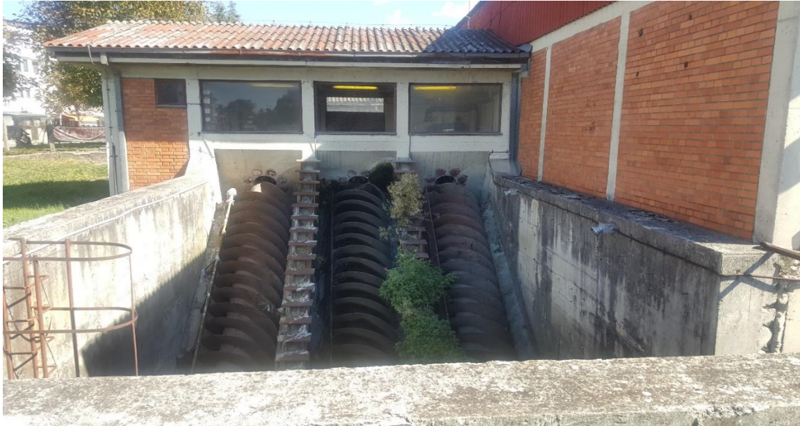
Пумпна станица за одведување на отпадните води од колекторскиот систем

Во наредниот период потребно е да се извршат санации, реконструкции и поправки на колекторскиот систем, набавка на реагенси за вршење на испитување на квалитетот на пречистената отпадна вода во лабораторијата, како и доставување на податоци за квалитетот на отпадните води од колекторскиот систем со цел поголема функционалност на колекторскиот систем со што ќе се овозможи и поголема ефикасност во заштитата на Охридското езеро.