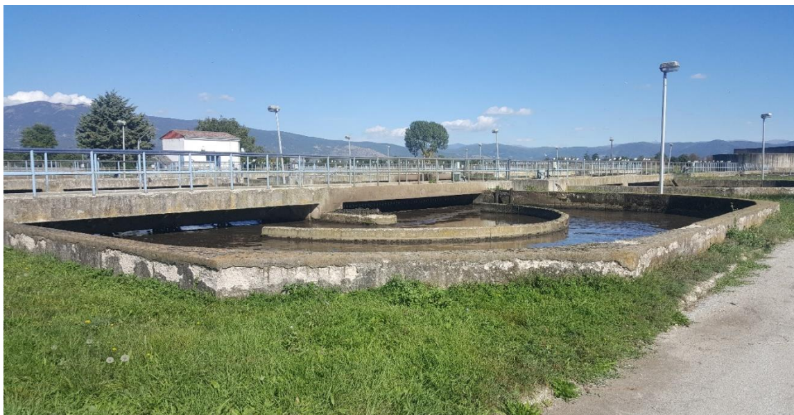
Пречистителна станица за отпадни води во Враништа – Струга