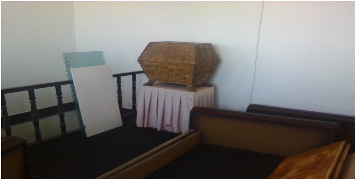
Саркофаг во кој биле сместени останките на Никола Карев

Од сето горенаведено се констатира дека Збирката на историски документи, фотографии, оружје, воена опрема и уметнички предмети како заштитена збирка на културно наследство од особено значење која подлежи на режим на заштита од прв степен, се чува во крајно лоши услови кои допринесуваат за оштетување на истата.