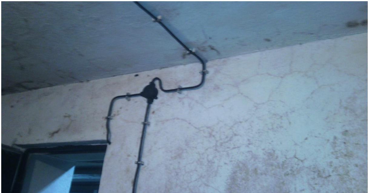
Депо во ЛУ Музеј на град Скопје

Во текот на 2014 година од страна на МК во соработка со институциите од областа на музејската дејност, изготвен е Акционен план за осовременување на музејските поставки и депоата. Истиот е усвоен од Владата на РМ, и им се укажува на надлежните музејски установи, во соработка со МК, да ги дефинираат проектите за воспоставување постојани поставки и за осовременување на депоата на музеите, во своите нацрт-програми за периодот 2015-2017 година, со цел нивна реализација, а за динамиката на реализацијата, на секои шест месеци да ја информираат Владата преку Министерството за култура.