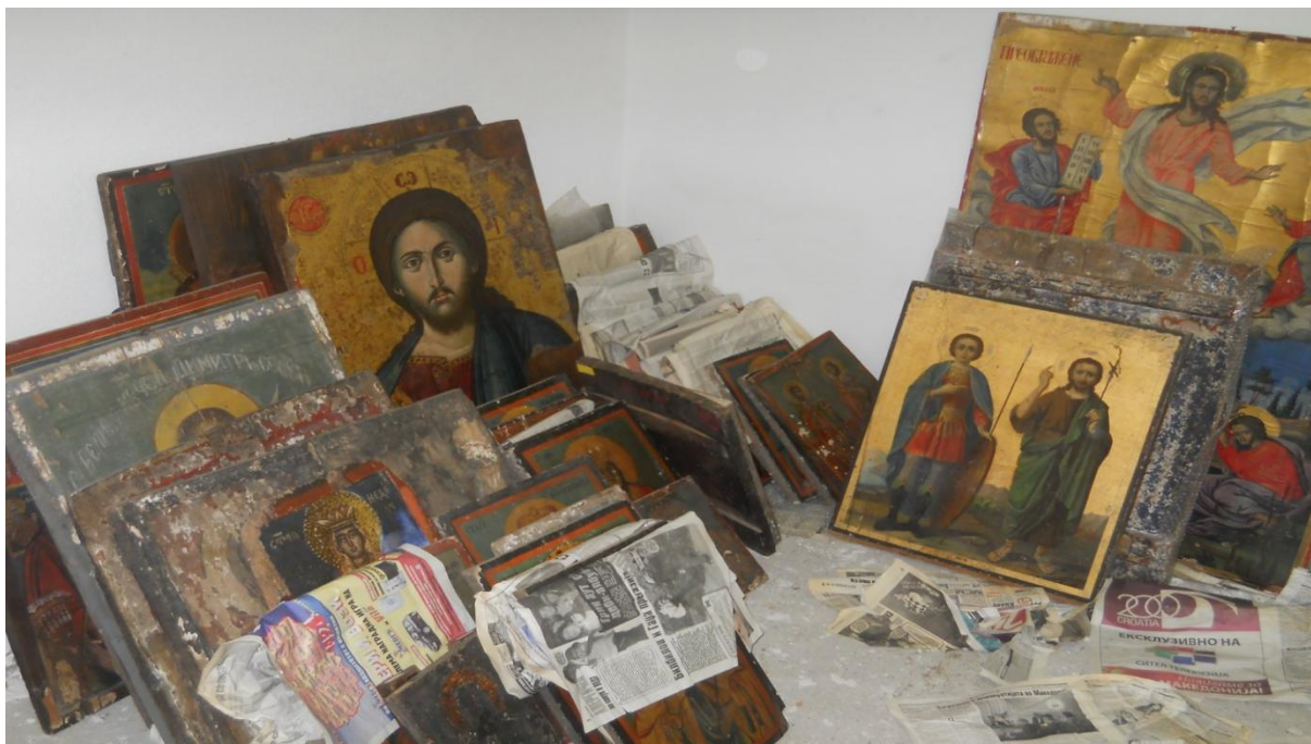
Депо во НУ ЗЗСК и Музеј Прилеп